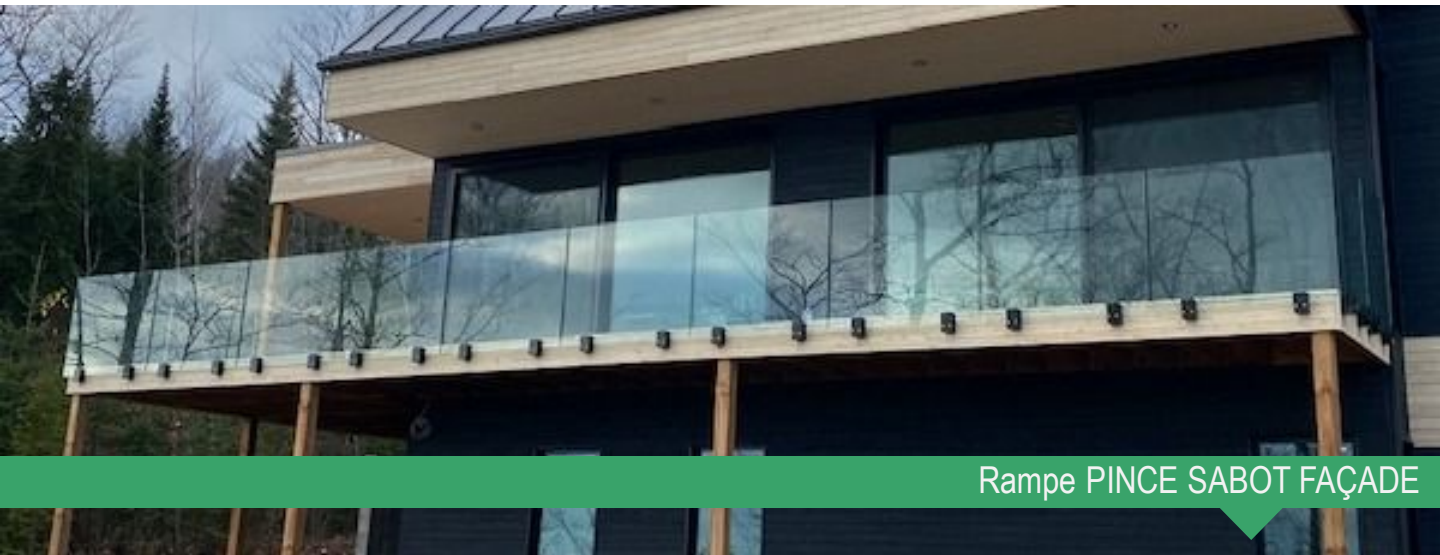
Rampe PINCE SABOT FAÇADE